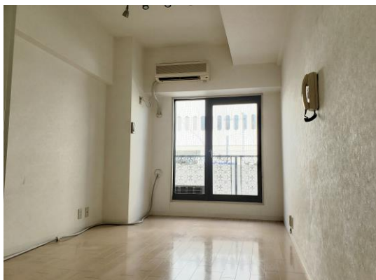
図面と現況が異なる場合、現況優先とします。