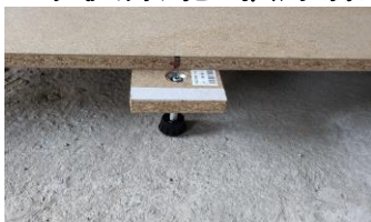
階下に優しい2重床