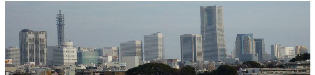
【リビングからの眺望 H22.2撮影】