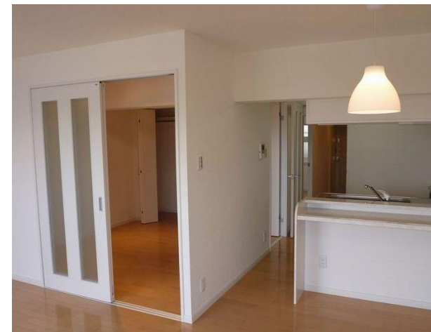
【キッチン/洋室 H22.2撮影】