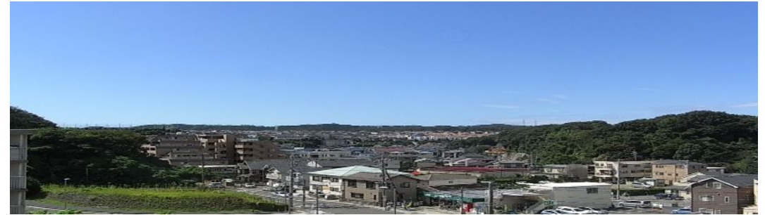
【リビングからの眺望H.23.9撮影】