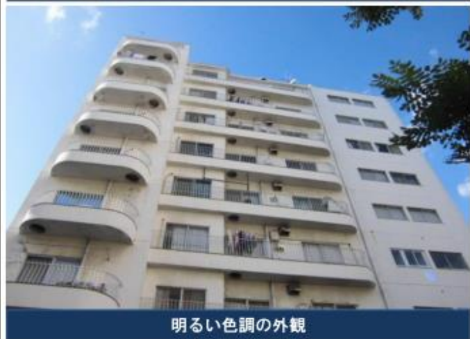
明るい色調の外観