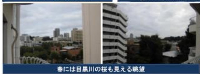
春には目黒川の桜も見える眺望