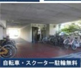
自転車・スクーター駐輪無料