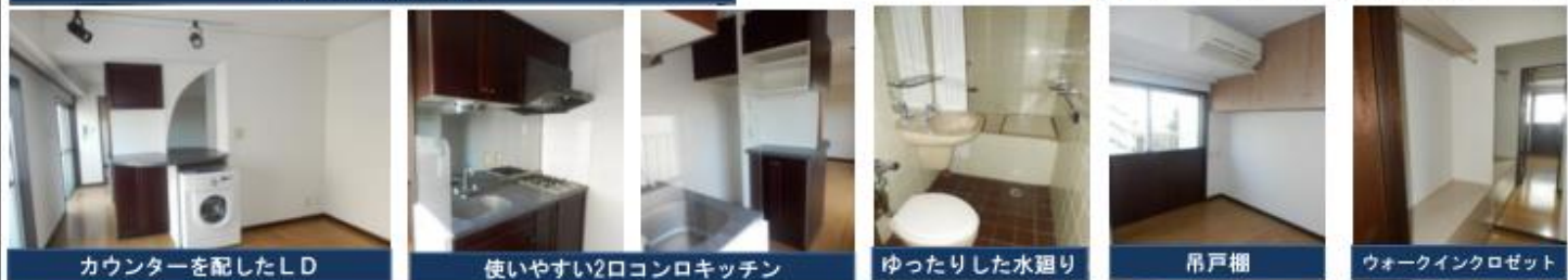
カウンターを配したLD