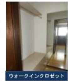
ウォークインクローゼット