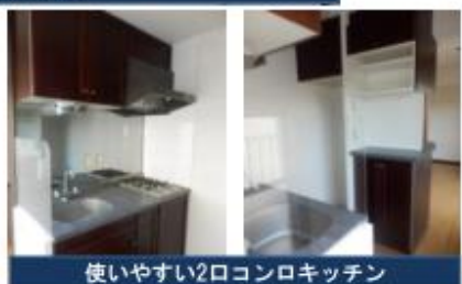
使いやすい2口コンロキッチン